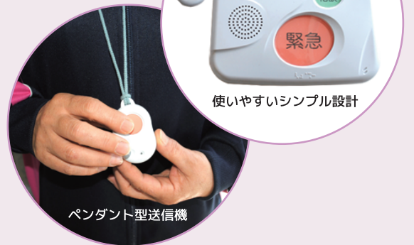
使いやすいシンプル設計

随時対応における訪問の要否判断に基づき、ヘルパーがご利用者様宅を訪問し、必要な介護サービスを提供します。